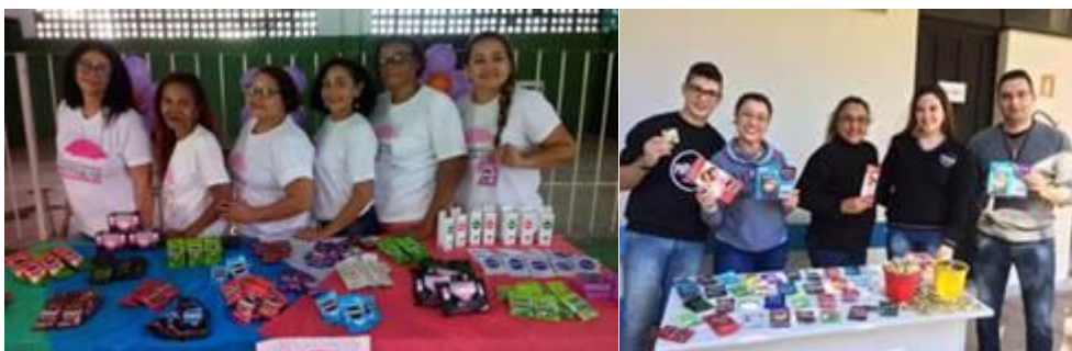
Voluntários das ONGs durante ações de conscientização

Em parceria com as ONGs Gestos, Equipe Voluntária Brasil e Barong, a empresa visa incentivar a disseminação da importância da prática do sexo seguro e do planejamento familiar, por meio de ações de Marketing Social